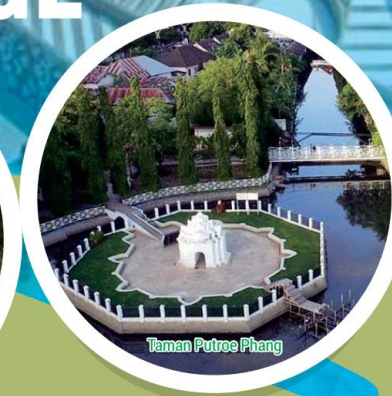
Taman Putroe Phang